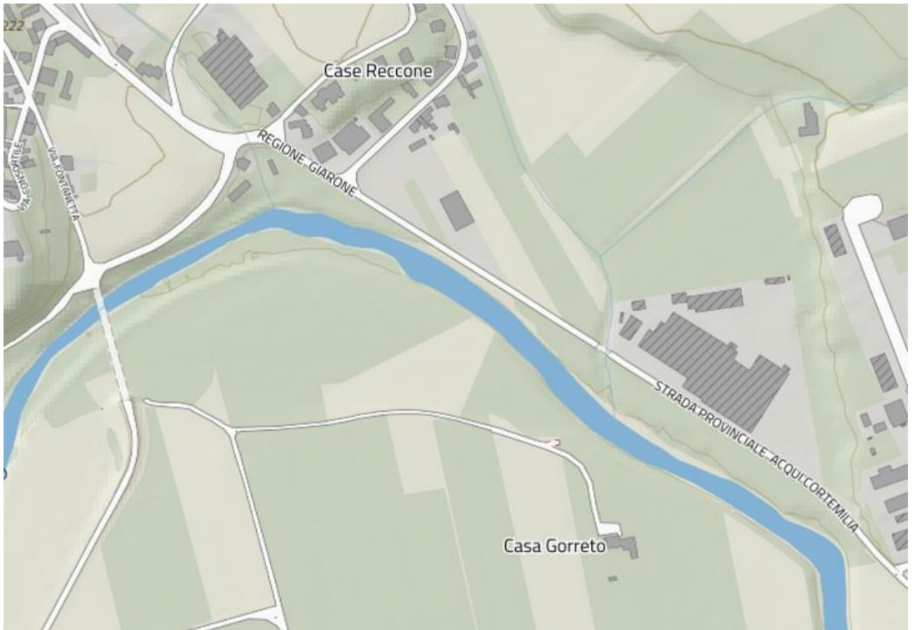
Figura 2.2: Estratto B.D.T.R.E. 2022 con individuazione dell'area di intervento