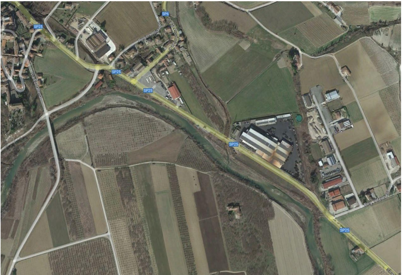
Figura 2.1: foto aerea del tratto di fiume Bormida interessato dagli interventi